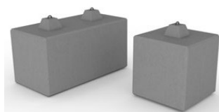
Muros de contenção